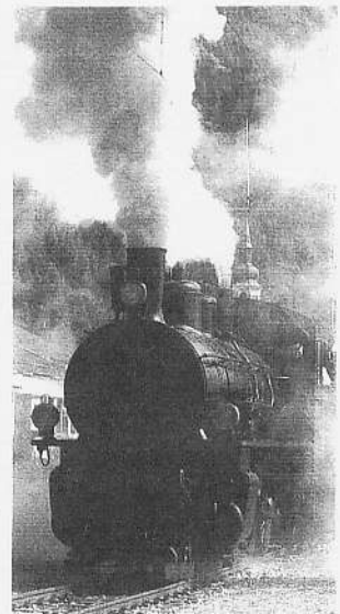
Dampfbahn. Im Baselbiet wird die Wiederaufnahme des Dampftriebs im Homburgertal diskutiert.

Über diese Wünsche konnten sich die Kantonsbehörden ebenso wenig wie der Verwaltungsrat der Birseckbahn hinwegsetzen. Politisch waren die Wei-