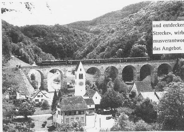
JuraZytig · Nr. 2 | September 09

«Kommen Sie und entdecken Sie die Schönheiten dieser Strecke», wirbt Margrit Balscheit, Tourismusverantwortliche von Läufelfingen, für das Angebot.